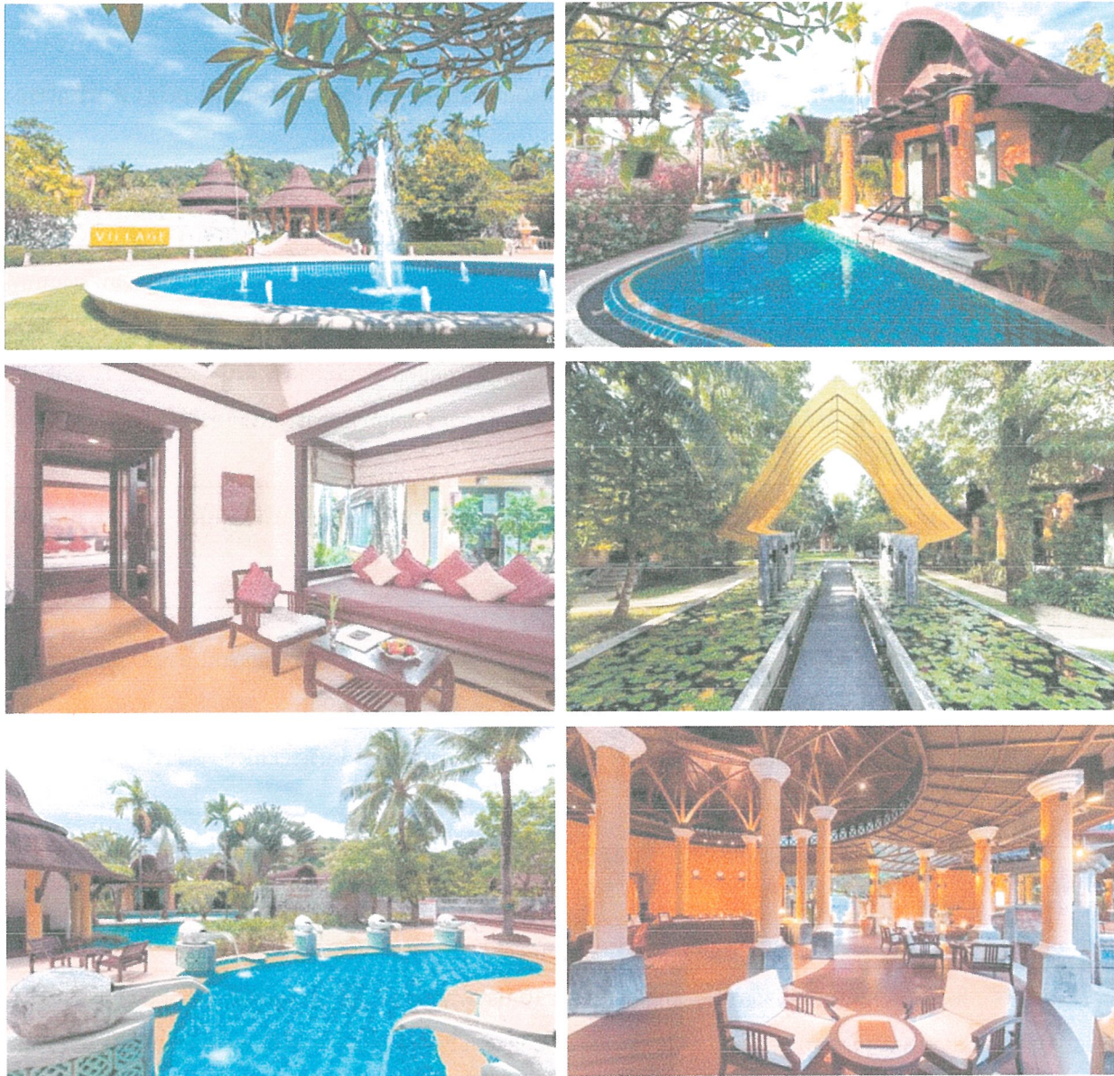
รูปภาพที่ 1.4 การใช้พื้นที่ของโครงการ