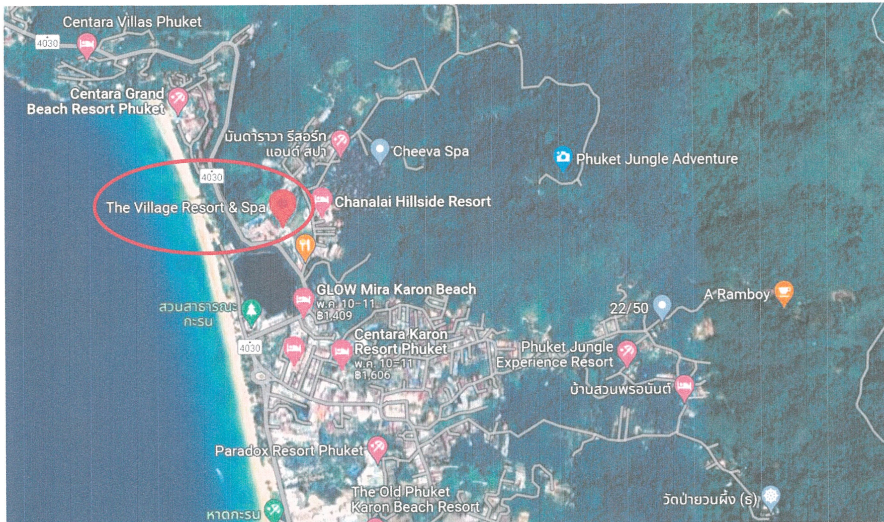
รูปภาพที่ 1.1 แผนที่ตั้งของโครงการ เดอะ วิลเลจ รีสอร์ท แอนด์ สปา (Top view)

ระยะดำเนินการ ระหว่างเดือน มกราคม – มิถุนายน 2566